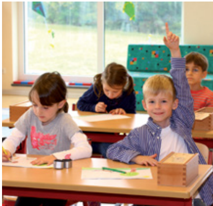
Der bilinguale Unterricht vermittelt Sprachsicherheit für die Zukunft