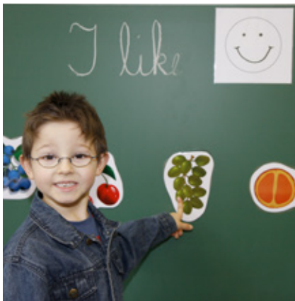
Der Anteil des englischsprachigen Unterrichts beträgt zwischen 44 und 50 Prozent

Die Lehrer vermitteln als vorrangiges Ziel die Sachinhalte der Fächer, nicht die Sprache. Die Sprache ist ein „Transportmittel“. Sofern sich anfangs Rückstände im Sachwissen ergeben, verschwinden sie im Verlauf der ersten beiden Jahre von selbst. Auch die Muttersprache kommt nicht zu kurz, ihre Entwicklung wird sogar positiv beeinflusst. In der 1. Klasse beginnen die Kinder mit der zweiten Fremdsprache.