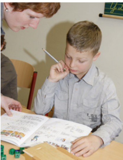
Individuelle Förderung durch kleine Klassen

Der musische Bereich spielt eine wichtige Rolle und wird ergänzt durch Flöten- und Orff-Instrumentalunterricht. Dieser Unterricht findet zunächst in deutscher Sprache, ab Klasse 3 auch in englischer Sprache statt. Durch die Verkürzung der Unterrichtsstunde von 45 auf 40 Minuten stehen im gebotenen Zeitrahmen insgesamt mehr Unterrichtsstunden zur Verfügung.