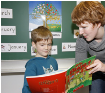
„Eintauchen“ in die neue Sprache