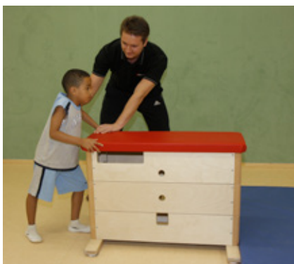
Turnunterricht im Sportraum