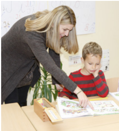
Die rhythmisierte Stundentafel gewährt eine effektive Lernorganisation